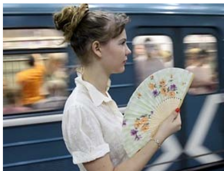
Общество защиты прав потребителей подало иск в суд к ГУП "Московский метрополитен", который не обеспечивает пассажирам комфортную температуру в период аномальной жары.

Мещанский суд Москвы провел предварительные слушания по иску Общества защиты прав потребителей к московскому метрополитену из-за жары и шума на станциях и в поездах. Рассмотрение по существу назначено на 10 сентября. Шансы на то, что иск будет удовлетворен в полном объеме, юристы считают незначительными.